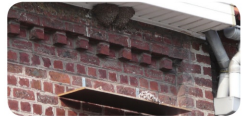
Nid naturel d'Hirondelle de fenêtre avec planchette, © Charlie Carels - GTH

Une grosse dose de patience : il faut du temps aux oiseaux pour trouver le nid installé, aussi soyez patient (taux d'occupation d'environ 60 %).