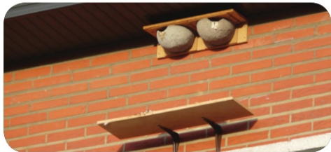
Nids artificiels d'Hirondelle de fenêtre avec planchette