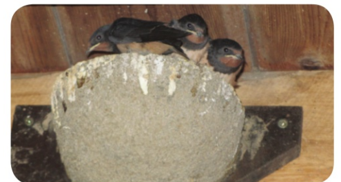
Niché d'Hirondelles rustiques, Secteur de Clermont (60)