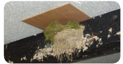
Nid d'Hirondelle rustique réutilisé par un Troglodyte mignon, Secteur de Montdidier (60)

Si une autre espèce s'installe (Rougequeue, Moineau domestique), ne la déloge pas, l'objectif est d'aider toute la biodiversité !