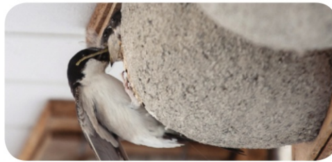
Hirondelle de fenêtre adulte nourrissant ses jeunes, Secteur d'Abbeville (80)