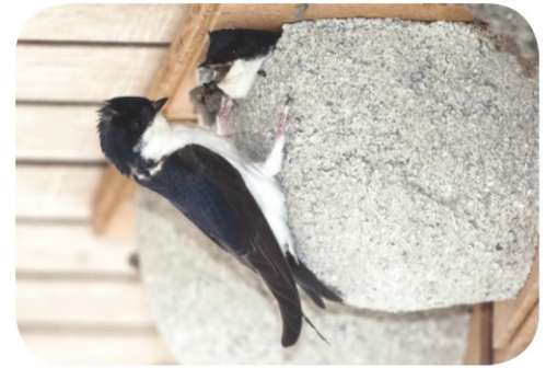
Adulte nourrissant les jeunes au nid, Secteur d'Abbeville

L'Hirondelle de fenêtre Delichon urbicum et l'Hirondelle rustique Hironda rustica sont des espèces protégées par la loi. La destruction d'oiseaux et de nids (occupés ou non) est interdite. L'association Picardie Nature apporte les conseils pour faciliter la prise en compte de ces oiseaux.