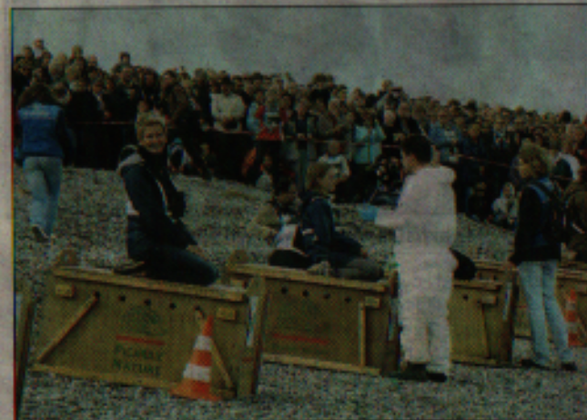
Dernier conseil par le responsable du centre de soins.

Sur les galets du Hourdel, dès 10 h, une marée humaine s'est massée dans la zone limitée par l'association. Rester