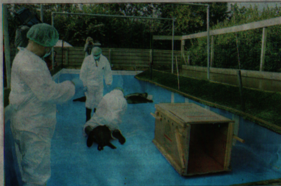
Un dernier contrôle vétérinaire avant le départ du centre de soins.