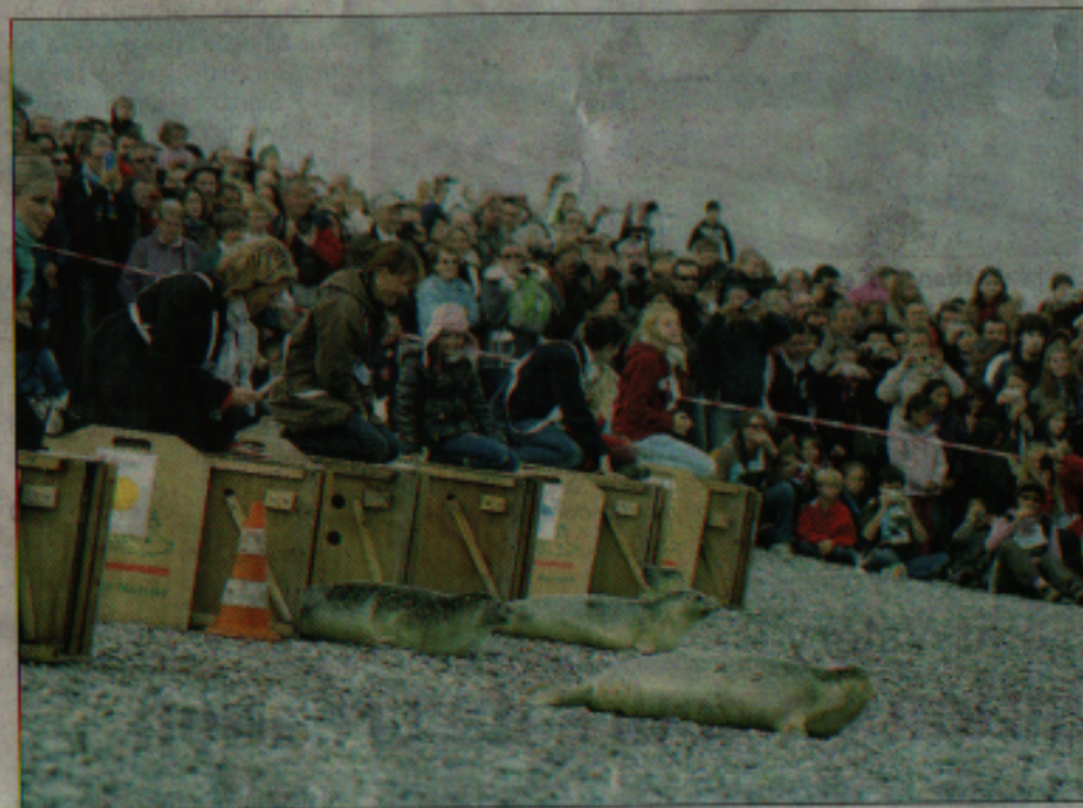
Retour à la liberté après trois mois de soins.

Echoués cet été et recueillis au centre de soins de Picardie Nature dix jeunes phoques veaux marins ont retrouvé la mer dimanche matin. Comme des stars ils ont été admirés et photographiés par une foule considérable réunie à la pointe du Hourdel.