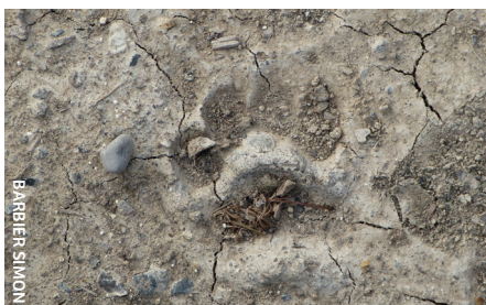
Empreintes de blaireau d'Europe